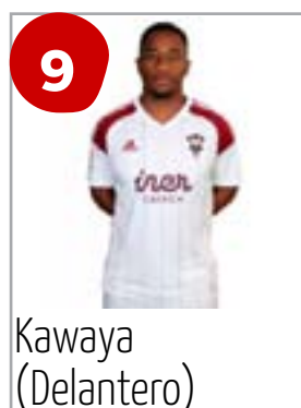
9 Kawaya (Delantero)