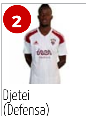
2 Djetei (Defensa)