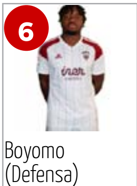
6 Boyomo (Defensa)