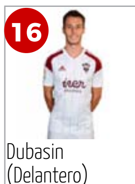
16 Dubasin (Delantero)