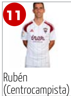
11 Rubén (Centrocampista)