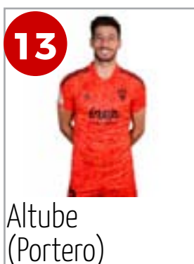
13 Altube (Portero)