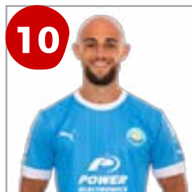
10 Ekain (Delantero)