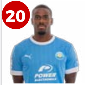
20 Appin (Delantero)