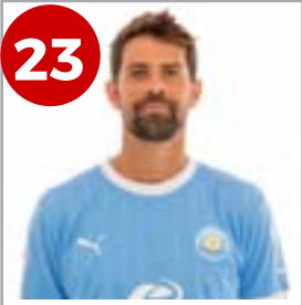
23 Coke (centrocampista)