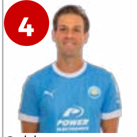
4 Goldar (Defensa)