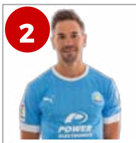
2 Grima (Defensa)