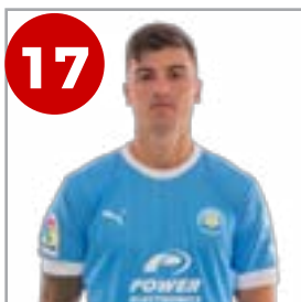
17 Castel (Delantero)