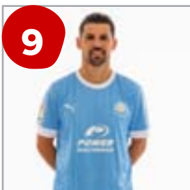
9 Nolita (Delantero)